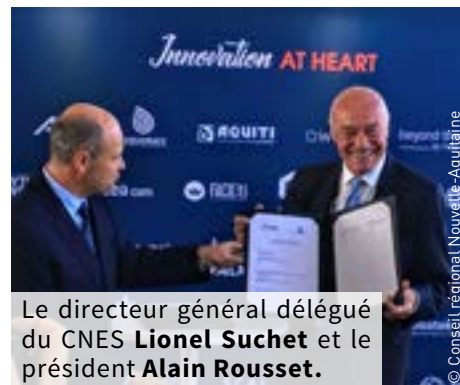
Le directeur général délégué du CNES Lionel Suchet et le président Alain Rousset .

Et si les entreprises et collectivités territoriales de Nouvelle-Aquitaine intégraient les applications spatiales mises au point par le Centre National d'Études Spatiales (CNES) ? C'est le pari du partenariat signé par la Région Nouvelle-Aquitaine avec le Centre National d'Études spatiales, le 24 août dernier, à l'occasion du G7, à Biarritz. En se rapprochant de l'établissement public qui conçoit, met en orbite des satellites et invente les systèmes spatiaux de demain, la Région compte bien contribuer à l'émergence de nouveaux services, grâce à la modélisation des données des images satellites, croisées avec des données socio-économiques. L'enjeu notamment : élaborer des scénarios d'impacts du changement climatique à destination des décideurs. Si tous les secteurs d'activités sont concernés, la Nouvelle-Aquitaine, première région agricole d'Europe, envisage de faire porter la priorité sur la transition agro-alimentaire. « Il s'agit aussi de mieux connaître, et donc de mieux gérer, un certain nombre d'éléments essentiels du patrimoine naturel : littoral et eaux de baignades, bassins hydrographiques, massifs forestiers, territoires viticoles ou les 26 000 zones humides et étangs de Nouvelle-Aquitaine », précise la Région dans un communiqué.