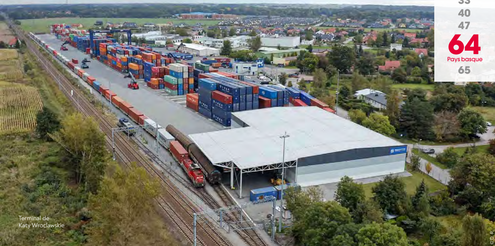
Terminal de Katy Wroclawskie