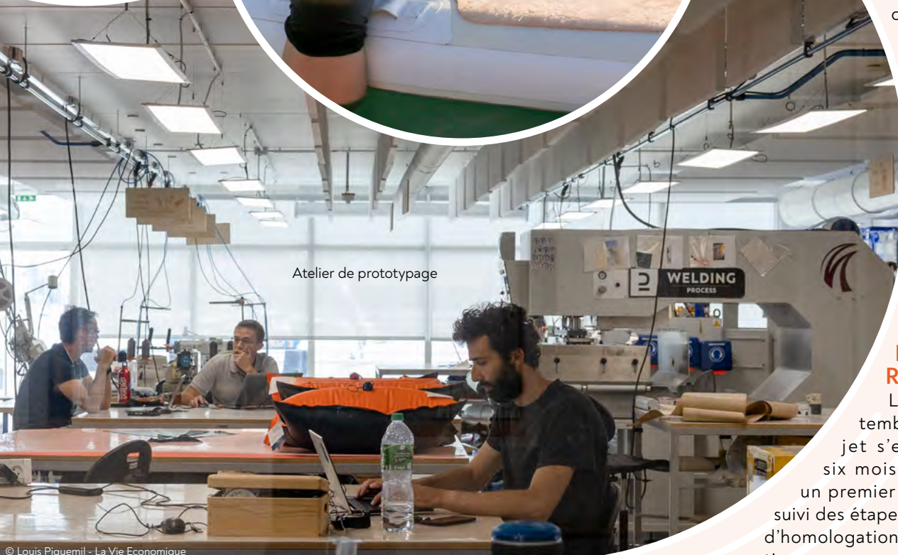
Atelier de prototypage