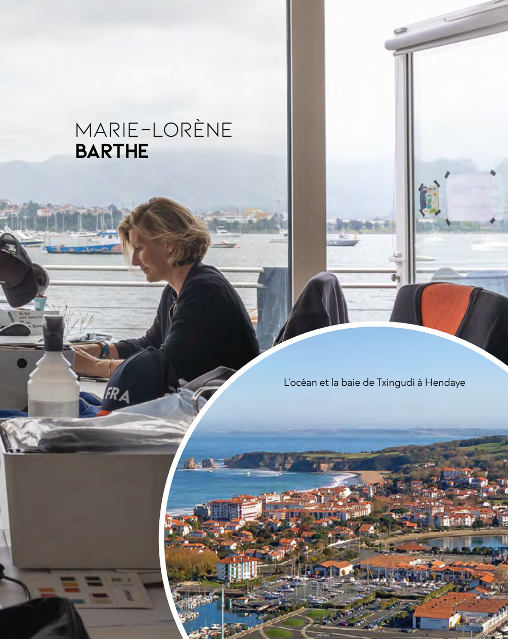
L'océan et la baie de Txingudi à Hendaye